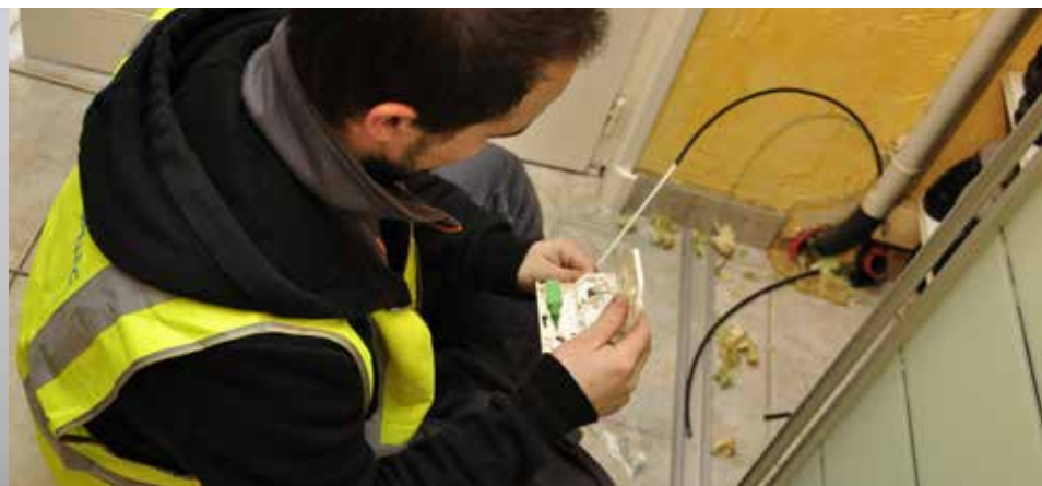
Le câble de fibre est souple et peut facilement être conduit dans une gaine. Son diamètre moyen est de 6 mm.