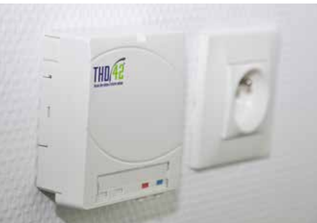
La prise terminale optique est impérativement posée à côté d'une prise électrique et idéalement à proximité du téléviseur.

IL EST IMPÉRATIF DE PRÉVOIR LE PASSAGE DE LA FIBRE CHEZ VOUS POUR QUE VOTRE RACCORDEMENT SOIT POSSIBLE.